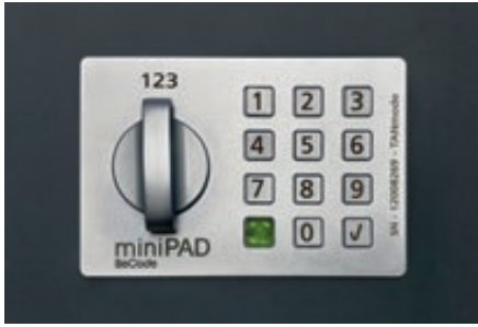
▲ Detail: PIN-Code-Schloss