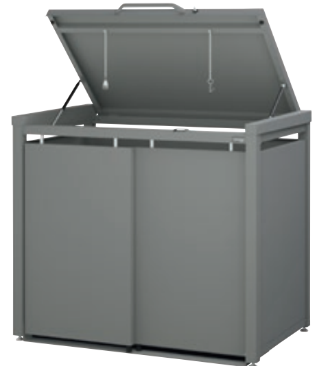
▲ Müllbehälter-Doppelschrank STYLEOUT® BLANK, mit Klappdach, Aluminiumkonstruktion in RAL 9007 grau-aluminium

Weitere Ausführungen finden Sie online unter: www.ziegler-metall.de