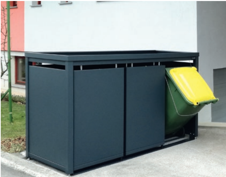
Müllbehälter-Dreifachschrank STYLEOUT® BLANK mit Pflanzdach, Aluminiumkonstruktion in RAL 7016 anthrazitgrau