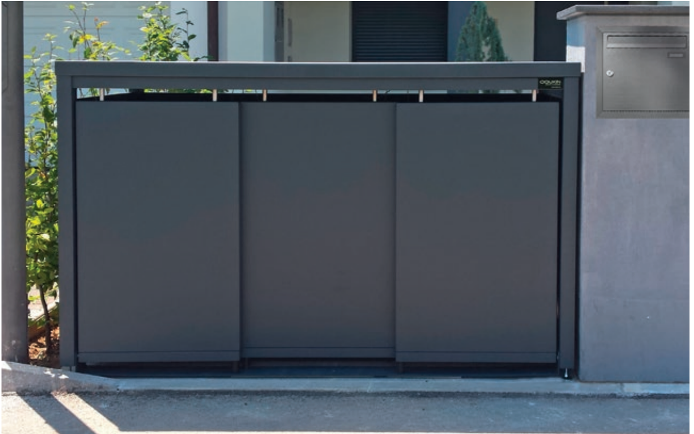
Müllbehälter-Dreifachschrank STYLEOUT® BLANK mit Pflanzdach, Aluminiumkonstruktion in RAL 7016 anthrazitgrau