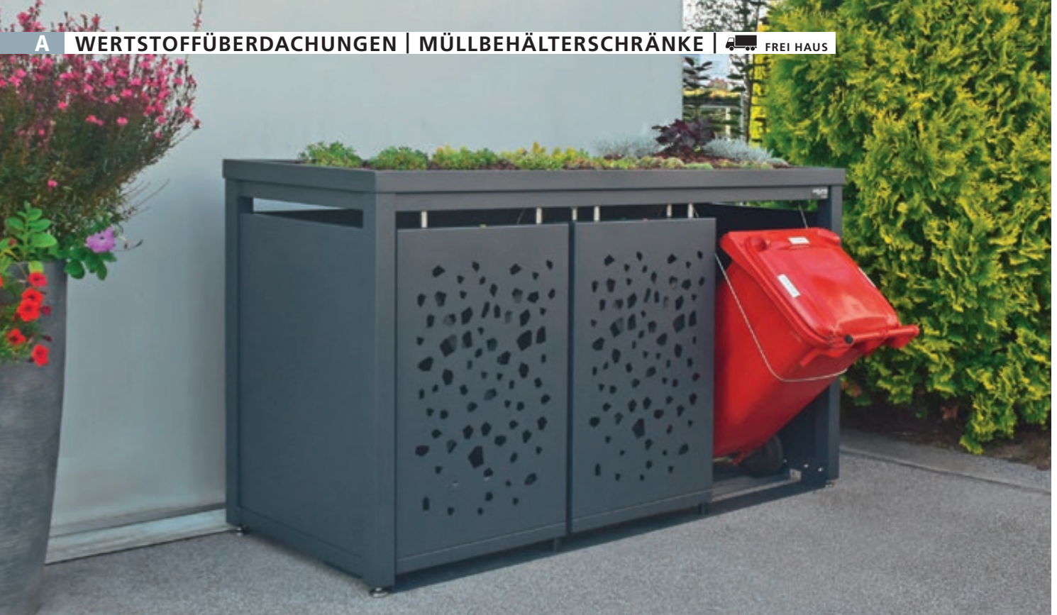
Müllbehälter-Dreifachschrank STYLEOUT® TOMO mit Pflanzdach, Dachbegrünung (bauseits), Aluminiumkonstruktion in RAL 7016 anthrazitgrau