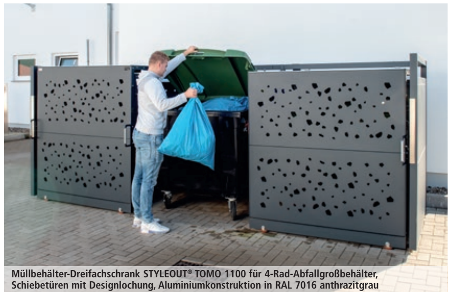
Müllbehälter-Dreifachschrank STYLEOUT® TOMO 1100 für 4-Rad-Abfallgroßbehälter, Schiebetüren mit Designlochung, Aluminiumkonstruktion in RAL 7016 anthrazitgrau