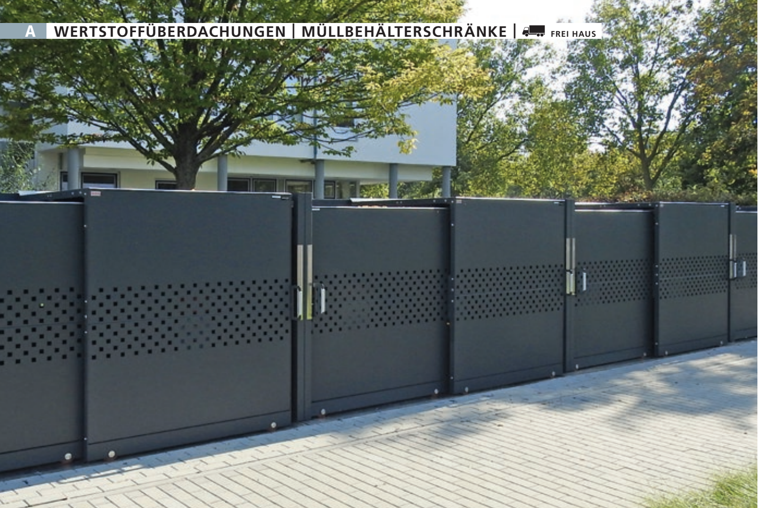
Müllbehälter-Doppelschrank STYLEOUT® QUBIS 1100 für 4-Rad-Abfallgroßbehälter, Schiebetüren mit Quadratlochung, Aluminiumkonstruktion in RAL 7016 anthrazitgrau