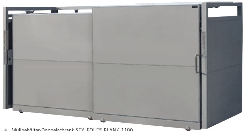
▲ Müllbehälter-Doppelschrank STYLEOUT® BLANK 1100, Aluminiumkonstruktion in RAL 9007 grau/aluminium