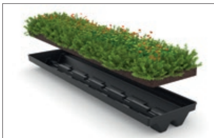
▲ Sedum-Kassettensystem aus recyceltem HDPE für Raucherunterstand AQUILA GREEN