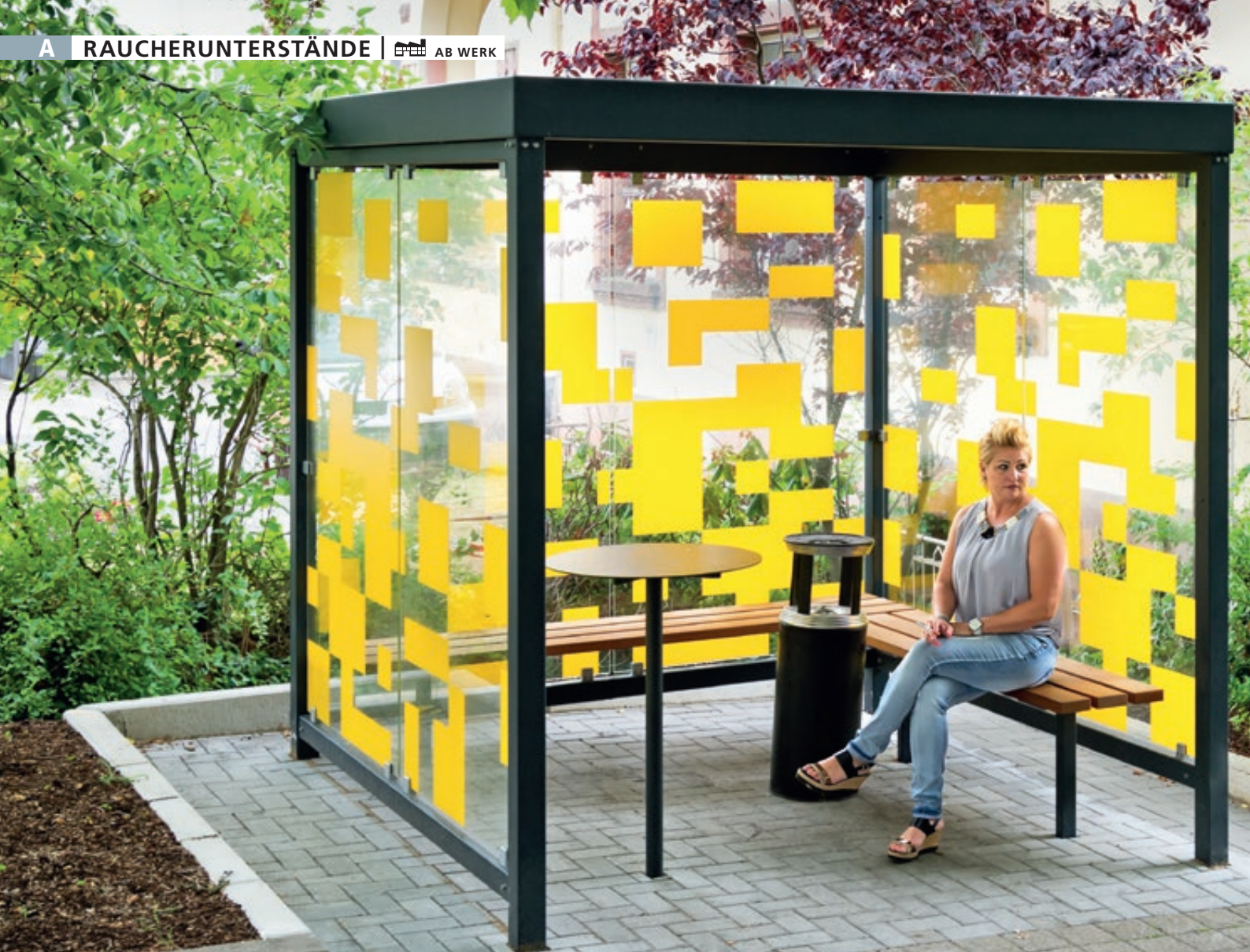
Raucherunterstand TOBACCO, Dachbreite x Dachtiefe 2400 mm x 2400 mm, mit Rück- / Seitenwänden, zweiseitige Sitzbank TOBACCO, Abfallbehälter / Ascher CALGARY sowie Stehtisch BISTROT, Stahlkonstruktion in RAL 7016 anthrazitgrau, Scheibendekorbeklebung bauseits