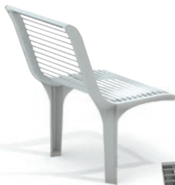
▲ Sitz EMAU SOLO mit Rückenlehne, Auflage Sitzfläche und Rückenlehne aus Edelstahl