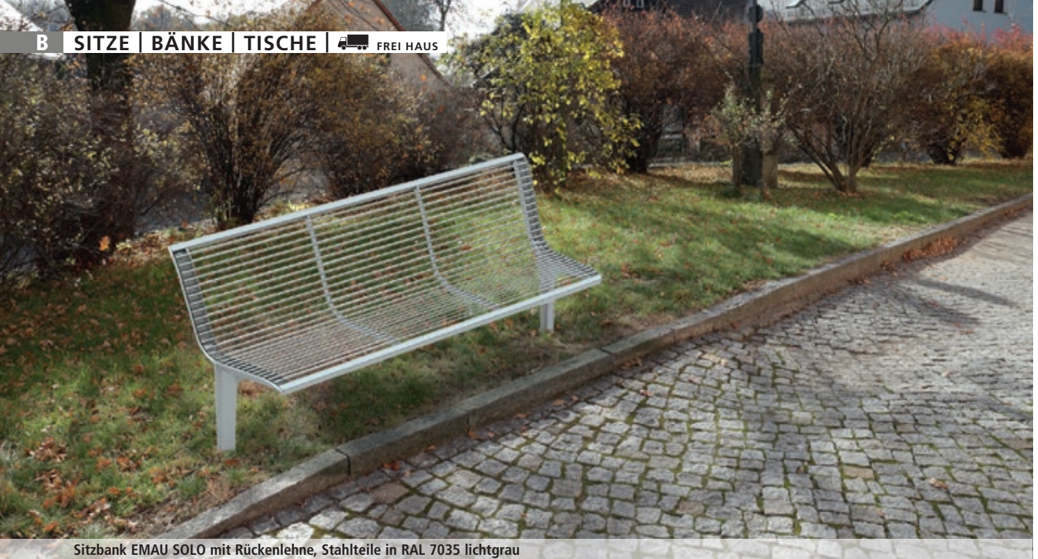
Sitzbank EMAU SOLO mit Rückenlehne, Stahlteile in RAL 7035 lichtgrau