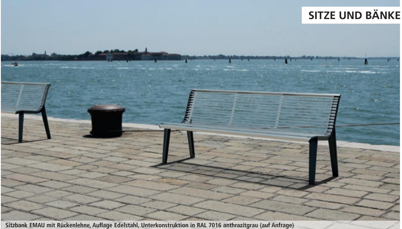
Sitzbank EMAU mit Rückenlehne, Auflage Edelstahl, Unterkonstruktion in RAL 7016 anthrazitgrau (auf Anfrage)