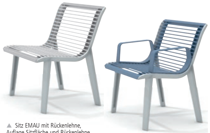
▲ Sitz EMAU mit Rückenlehne, Auflage Sitzfläche und Rückenlehne aus Edelstahl