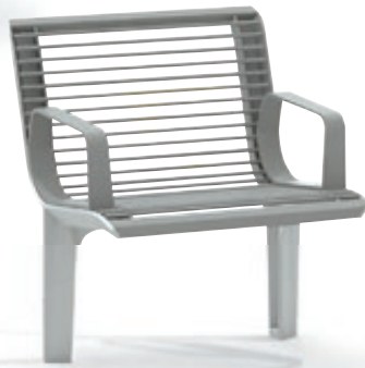
► Sitz EMAU SOLO mit Rückenlehne und Armlehnen, Stahlteile in RAL 9007 graualuminium

Konstruktion: Sitz und Sitzbank mit Unterkonstruktion aus Aluminiumguss. Wahlweise mit Armlehnen. Sitzfläche und Rückenlehne aus Rund- oder Edelstahl. Armlehnen bei Rundstahlausführung aus Stahlblech, bei Edelstahlausführung aus Edelstahl.