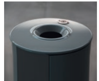
▲ Detail: Einwurföffnung