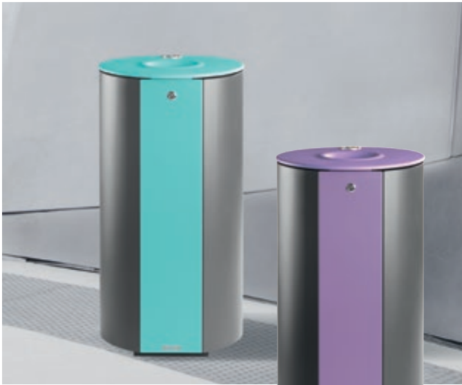
▲ Abfallbehälter MIANE mit Ascher, Stahlteile in RAL 6027 lichtgrün und RAL 9007 graualuminium bzw. Stahlteile in RAL 4005 blaulila und RAL 7012 basaltgrau