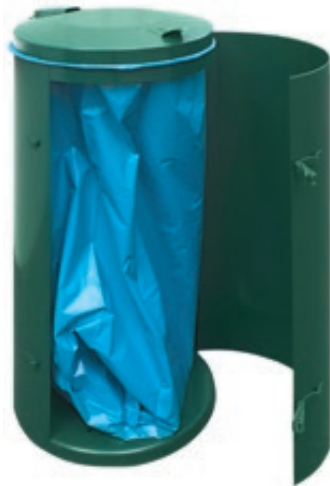
▲ Abfallbehälter SOMERSET, in RAL 6005 moosgrün, zum freien Aufstellen, Tür geöffnet

Weitere Abfallbehälter finden Sie online unter: www.ziegler-metall.de