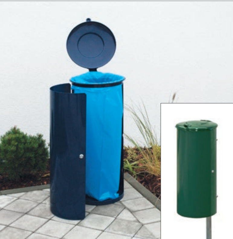
▲ Abfallbehälter NEWPORT, 110 Liter, zum Aufdübeln, in RAL 5013 kobaltblau