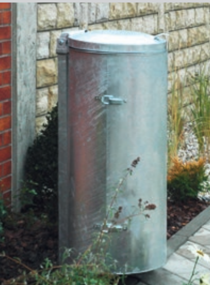
▲ Abfallbehälter SOMERSET, feuerverzinkt, mit Pfosten zum Einbetonieren (Zubehör)