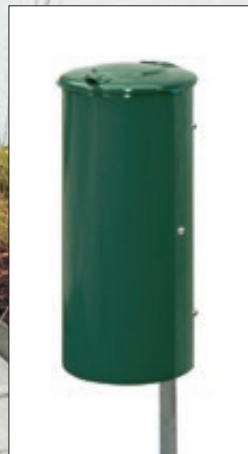
▲ Abfallbehälter NEWPORT, 110 Liter, zum Einbetonieren, in RAL 6005 moosgrün