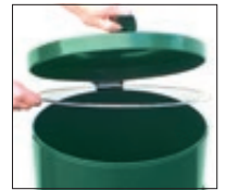
▲ Detail: Deckel geöffnet, Klemmring zur Abfallsackbefestigung