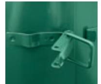
▲ Detail: Bügelverschluss