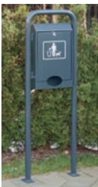
▲ Hundekotbeutel-spender COLLIE, zum Aufdübeln, in RAL 7016 anthrazitgrau