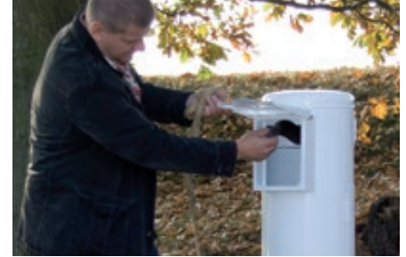
▲ Beutel entnehmen, Hundekot mit umgestülptem Beutel aufnehmen und zuknoten