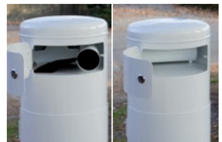
▲ Beutelspender befüllen

Weitere Hundetoiletten finden Sie online unter: www.ziegler-metall.de