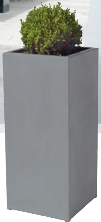
▲ Pflanzbehälter MALOUT, 53 Liter, Höhe 1000 mm, in RAL 9007 grau-aluminium