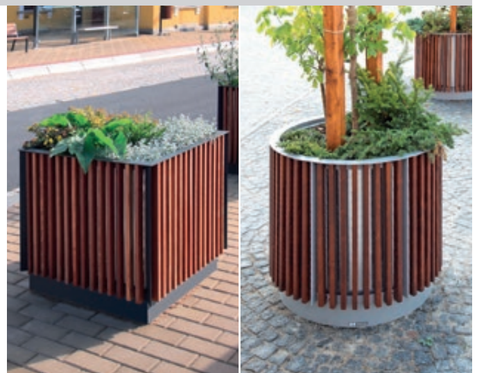
▲ Pflanzbehälter FLORIUM, quadratisch, mit Jatobaholzbelattung, Stahlteile in RAL 7016 anthrazitgrau