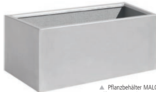
▲ Pflanzbehälter MALOUT, 132 Liter, Höhe 450 mm, in RAL 9006 weißaluminium