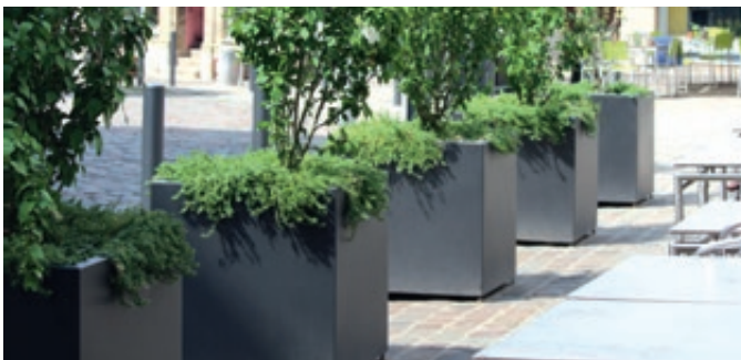
▲ Pflanzbehälter MALOUT, 246 Liter, Höhe 700 mm, in DB 703 eisenglimmer