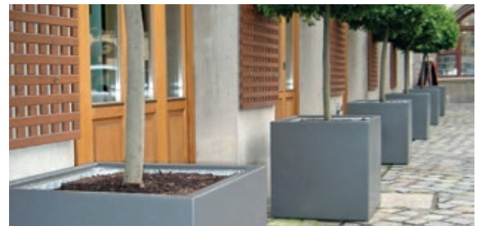
▲ Pflanzbehälter MALOUT, 191 Liter, Höhe 650 mm, in RAL 7046 telegrau 2