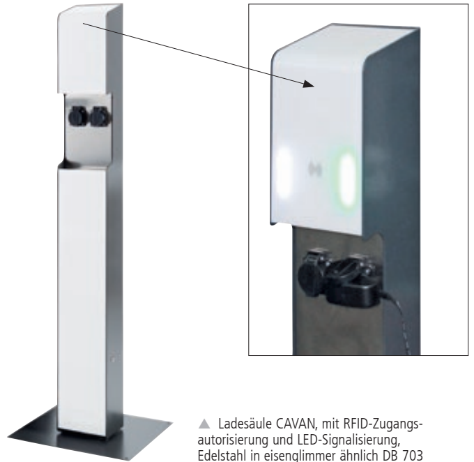
▲ Ladesäule CAVAN, mit RFID-Zugangsautorisierung und LED-Signalisierung, Edelstahl in eisenglimmer ähnlich DB 703