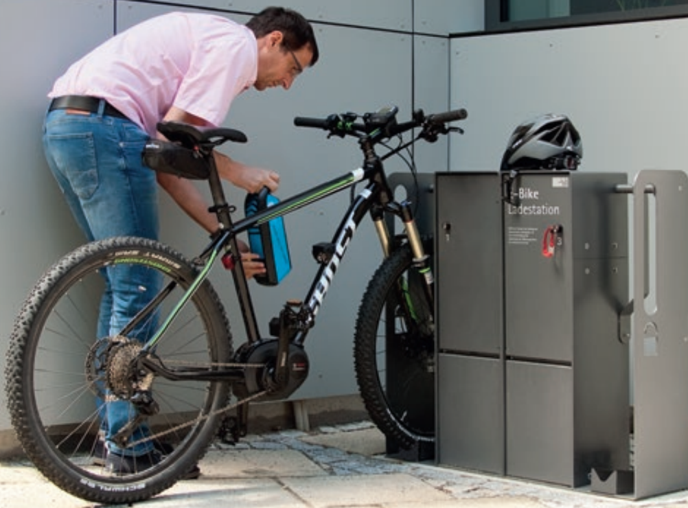
Fahrrad-Abstellanlage VELO-CONNECTOR mit Ladeschließfach, für Radeinstellung links bzw. rechts, Stahlteile in DB 703 eisenglimmer