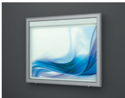
▲ Schaukasten LIMOGES zur Wandbefestigung, für 18 x DIN A4, Alu silber