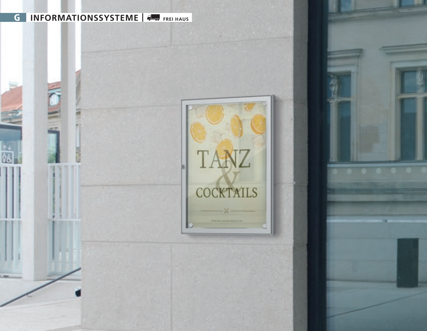
Schaukasten TESSALIA, für 4 x DIN A4, Hochformat, in Alu silber