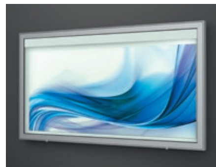
▲ Schaukasten LIMOGES zur Wandbefestigung, für 27 x DIN A4, Alu silber