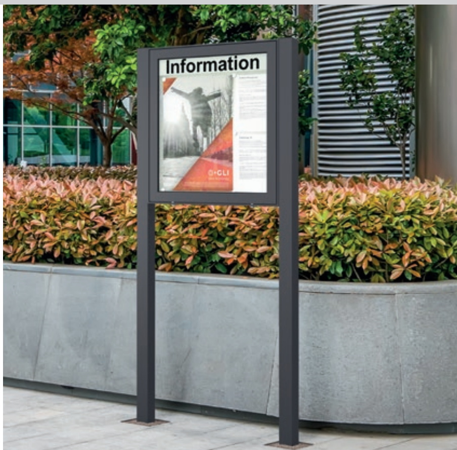
Schaukasten LIMOGES mit Rechteckrohrständer zum Einbetonieren (Zubehör), für 6 x DIN A4, mit Beschriftung (Zubehör), in DB 703 eisenglimmer

Befestigungsart: Zur Wandbefestigung, Befestigungsmaterial nicht im Lieferumfang enthalten bzw. mit Ständer wahlweise zum Einbetonieren (empfohlene Einbautiefe 300 mm) oder zum Aufdübeln bei +/- 0 mm, siehe Zubehör.