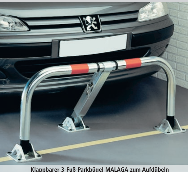
Klappbarer 3-Fuß-Parkbügel MALAGA zum Aufdübeln