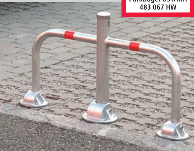
Parkbügel OSTARA zum Aufdübeln, ohne Bodenplatte, mittels Profilylinderschloss, feuerverzinkt