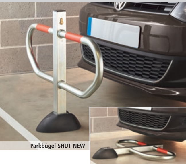
Parkbügel SHUT NEW