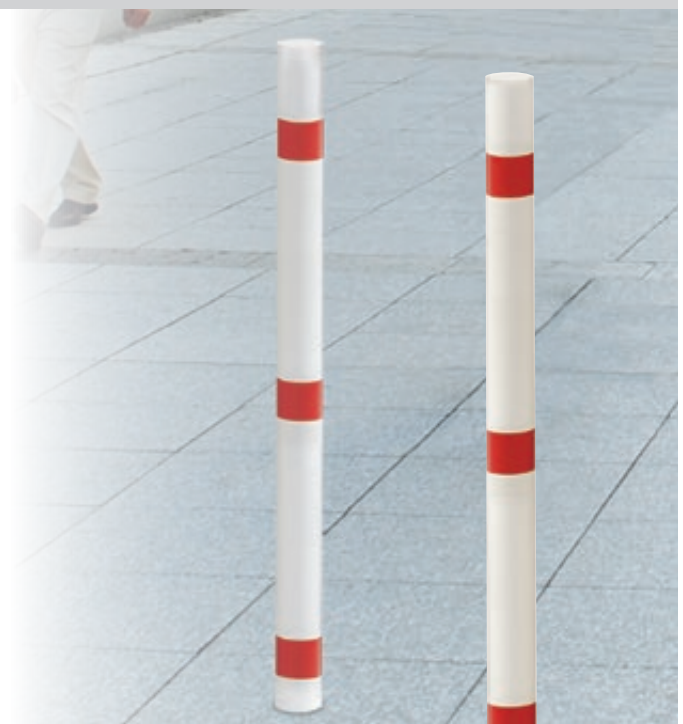
▲ Sperrpfosten MONTIJO zum Einbetonieren, weiß pulverbeschichtet mit roten Streifen

Pro Pfosten werden 2 Paar Schwerlastanker benötigt.