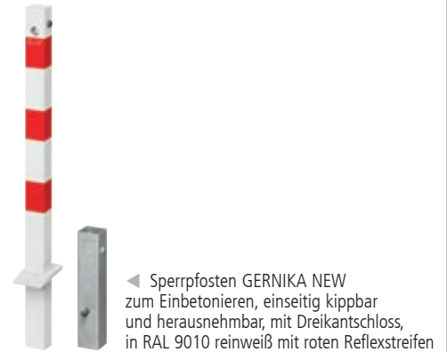
◀ Sperrpfosten GERNIKA NEW zum Einbetonieren, einseitig kippbar und herausnehmbar, mit Dreikantschloss, in RAL 9010 reinweiß mit roten Reflexstreifen

*Bei herausnehmbaren Sperrpfosten mit Kippfunktion wird zwingend ein Universalschlüssel benötigt.