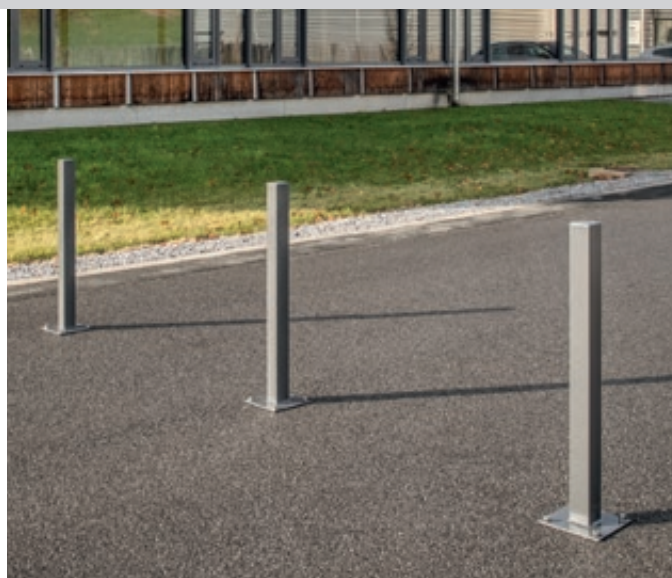
Sperrpfosten GERNIKA NEW zum Aufdübeln, mit Bodenplatte, in RAL 9007 graualuminium

Sperrpfosten LINARES finden Sie online unter: www.ziegler-metall.de