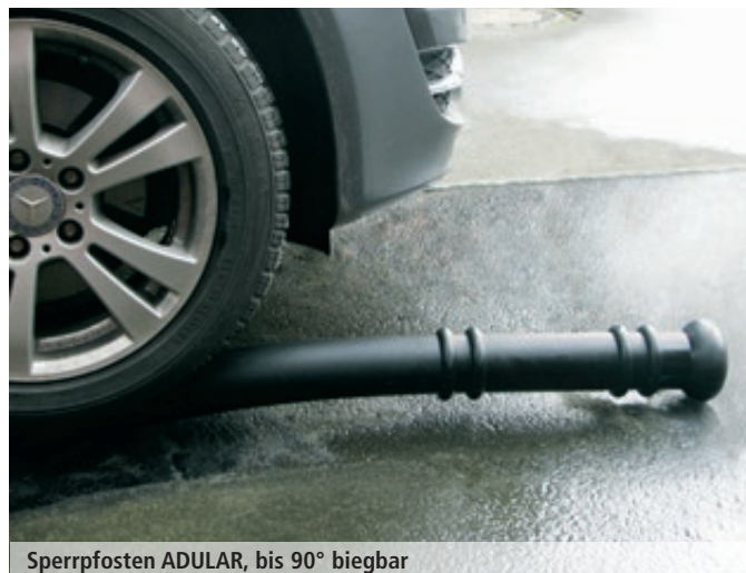
Sperrpfosten ADULAR, bis 90° biegsam