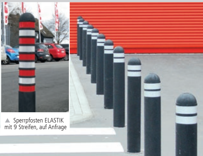
▲ Sperrpfosten ELASTIK mit 9 Streifen, auf Anfrage

Konstruktion: Runder Sperrpfosten aus vulkanisiertem Gummi.