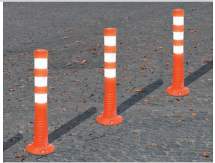
Leitpfosten AGIL in rot mit weißen Reflexstreifen, Höhe 750 mm