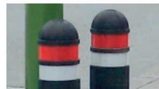
▲ Retroreflexstreifen in weiß und rot (siehe Mehrpreis)