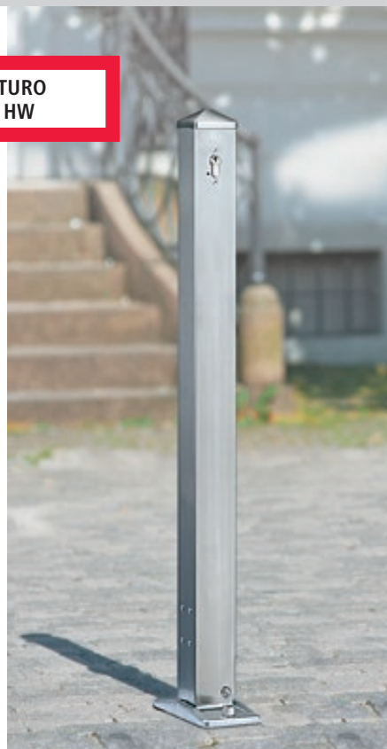
Poller ARTURO, abschließbar und kippbar