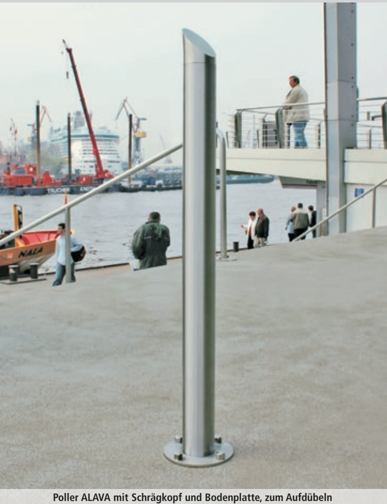
Poller ALAVA mit Schrägkopf und Bodenplatte, zum Aufdübeln

Konstruktion: Poller aus Edelstahl mit glatter und porenfreier Oberfläche.