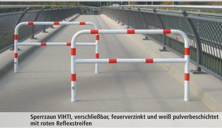
Sperrzaun VIHTI, verschließbar, feuerverzinkt und weiß pulverbeschichtet mit roten Reflexstreifen

Konstruktion: Sperrzaun aus Stahlrundrohr (Ø 60 mm).