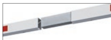
▲ Sperrbalken mehrteilig

Empfehlung: Sperrbreite bis 5 m - 1 Barriere, Sperrbreite ab 5,5 m - 2 Barrieren.