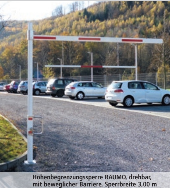
Höhenbegrenzungssperre RAUMO, drehbar, mit beweglicher Barriere, Sperrbreite 3,00 m

Konstruktion: Horizontal drehbare, alle 90° verriegelbare und ab 1000 mm stufenlos verstellbare Höhenbegrenzungssperre. Bestehend aus einer Hauptstütze aus Stahlrohr (Ø 102 mm), einem Drehbügel aus Edelstahl und einem Aluminium-Sperrbalken (86 x 46 mm) mit Antisitzschutz und Seilzugverstärkung. Lichte Durchfahrthöhe bis maximal 2800 bzw. 3800 mm. Barrierenabhängung aus Aluminium siehe Zubehör. Auf Anfrage mit Auflagstütze.