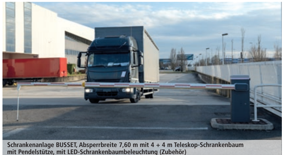
Schrankenanlage BUSSET, Absperrbreite 7,60 m mit 4 + 4 m Teleskop-Schrankenbaum mit Pendelstütze, mit LED-Schrankenbaumbeleuchtung (Zubehör)