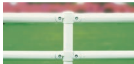
▲ lackiert in RAL 9016 verkehrsweiß