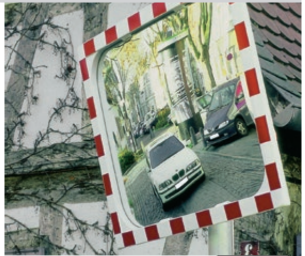
Spiegel mit Heizelementen finden Sie online unter: www.ziegler-metall.de