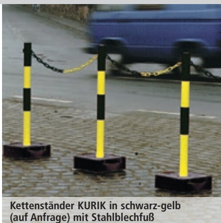
Kettenständer KURIK in schwarz-gelb (auf Anfrage) mit Stahlblechfuß

Konstruktion: Kettenständer aus Stahl (Ø 60 mm).