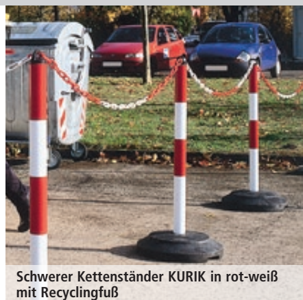
Schwerer Kettenständer KURIK in rot-weiß mit Recyclingfuß