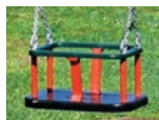
◀ Detail: Sicherheitsschaukelsitz