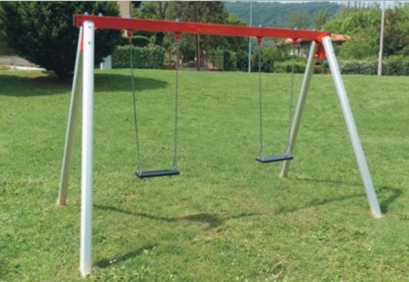
Doppelschaukel BIANCA mit Standardschaukelsitzen