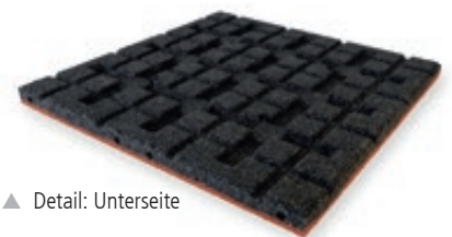
▲ Detail: Unterseite