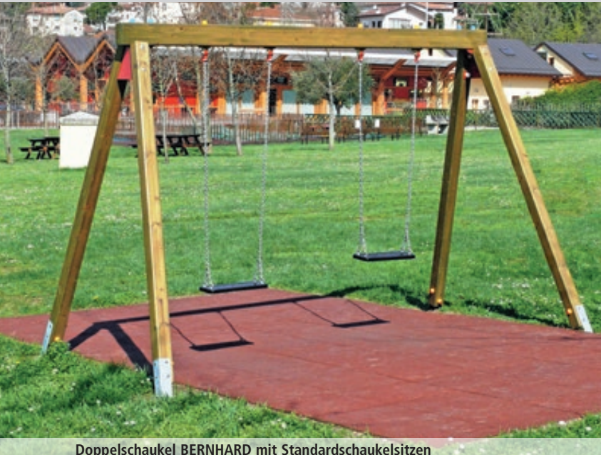
Doppelschaukel BERNHARD mit Standardschaukelsitzen