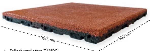
▲ Fallschutzplatten TANDEL