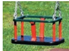
◀ Detail: Sicherheitsschaukelsitz