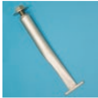
▲ Zubehör: Bodenverankerung für Hartplätze