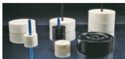
◀ Spielfiguren-Set DAME, klein und groß

Ein Set bestehend aus 16 weißen und 16 schwarzen Spielfiguren.