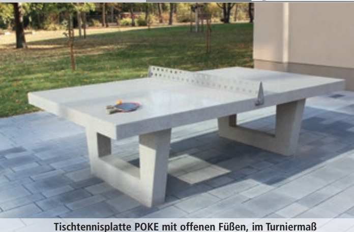
Tischtennisplatte POKE mit offenen Füßen, im Turniermaß