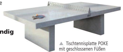
▲ Tischtennisplatte POKE mit geschlossenen Füßen

Anlieferung: Erfolgt fertig montiert (Entladen bauseits). Für die Entladung vor Ort wird ein Stapler benötigt.