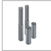
▲ Adapterkonstruktion bestehend aus je 2 x Adapter und Bodenhülse