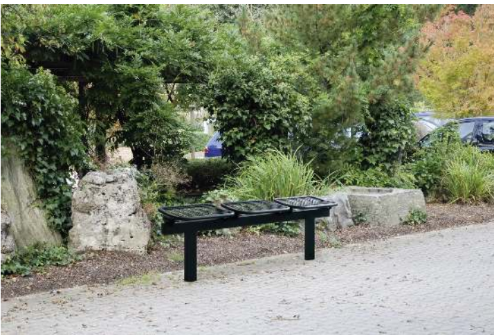
Drahtgittersitz TARVIS, 3-Sitzer zum Einbetonieren, in RAL 9005 tiefschwarz