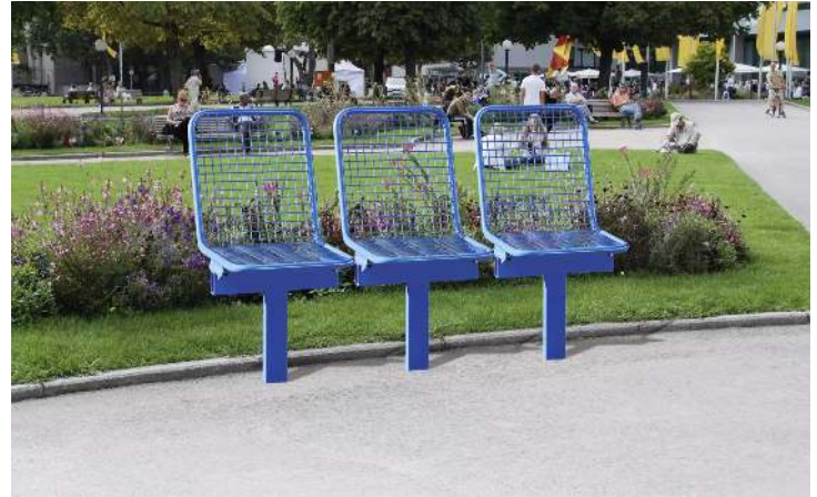
Drahtgittersitze TARVIS, 3 x 1-Sitzer zum Einbetonieren, in RAL 5017 verkehrsblau