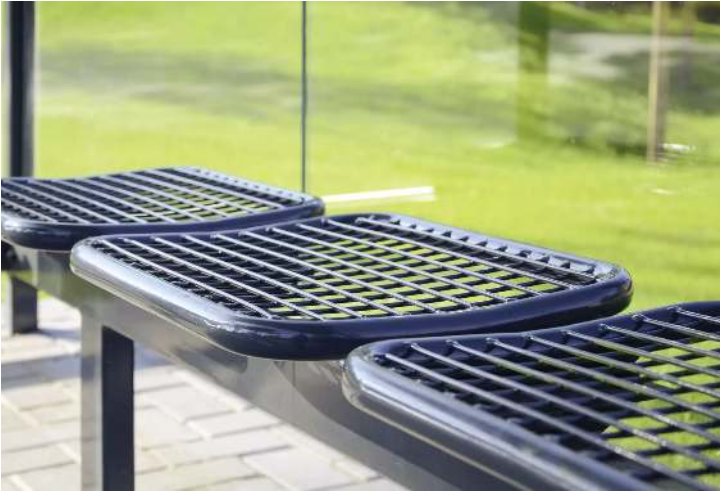
Drahtgittersitze TARVIS, 3-Sitzer, in RAL 7016 anthrazitgrau