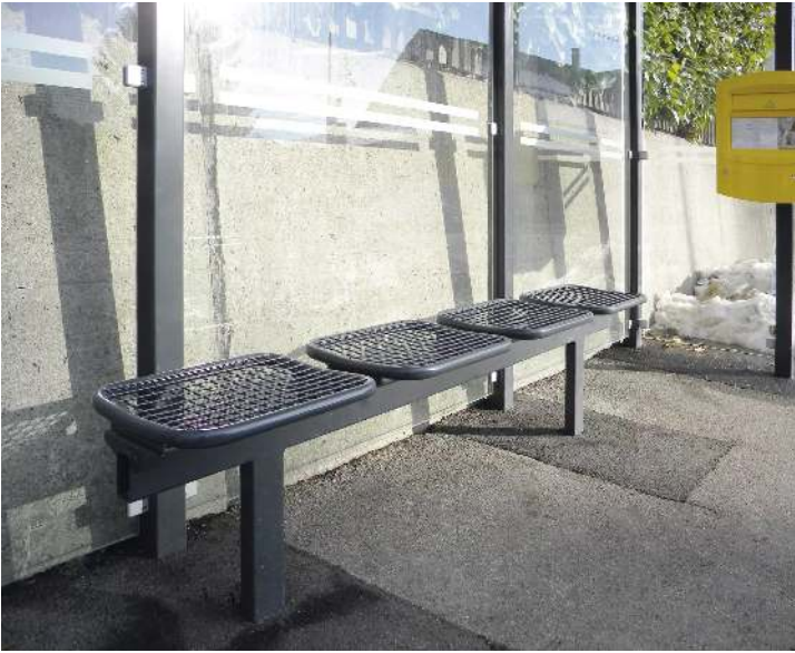
Drahtgittersitz TARVIS, 4-Sitzer zum Aufdübeln bei - 200 mm, in RAL 7016 anthrazitgrau