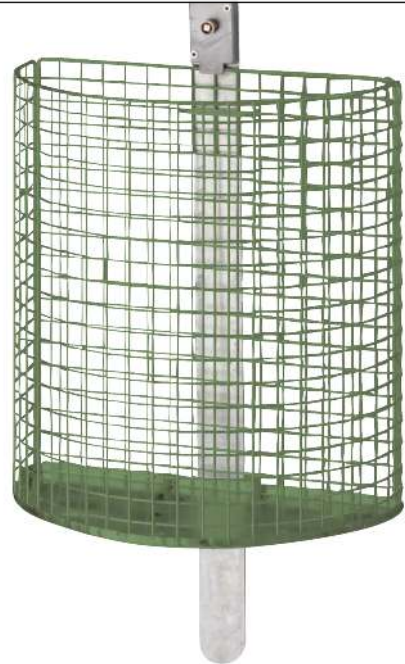
Abfallkorb WALES, zur Wandbefestigung, in RAL 6010 grasgrün