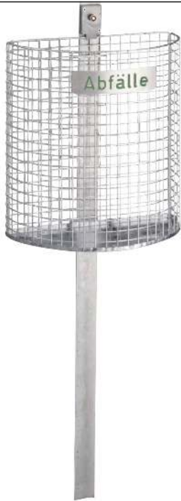
Abfallkorb WALES, zum Einbetonieren, feuerverzinkt