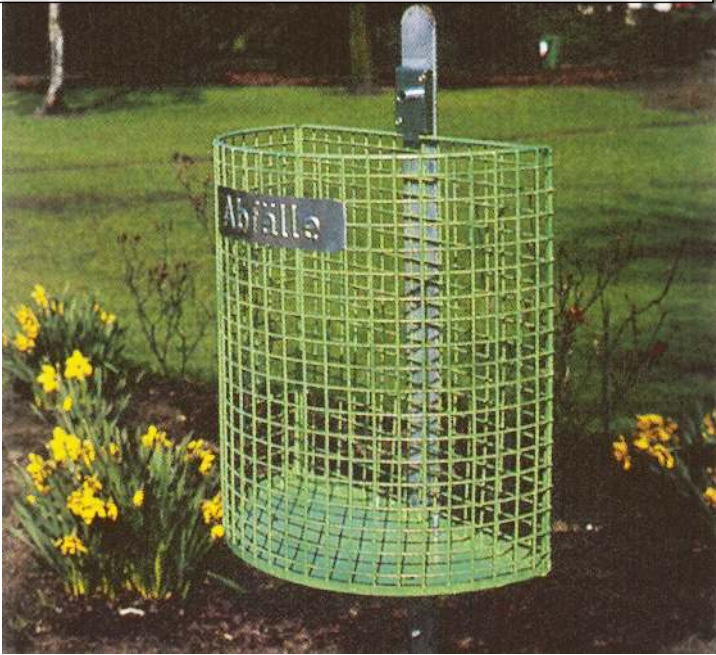
Abfallkorb WALES, zum Einbetonieren, in RAL 6010 grasgrün