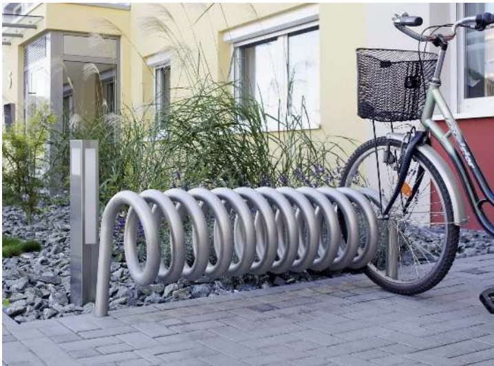
Fahrradständer DESIGN-PARKER zum Einbetonieren, Edelstahl