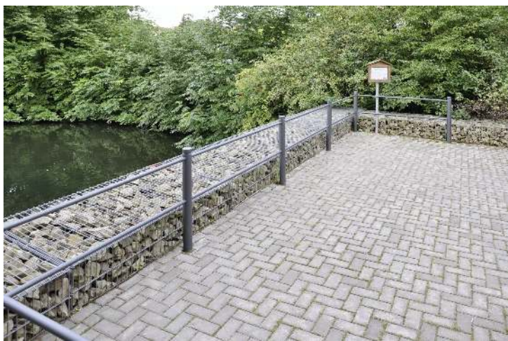
Detail: Mittelpoller BOULEVARD 83