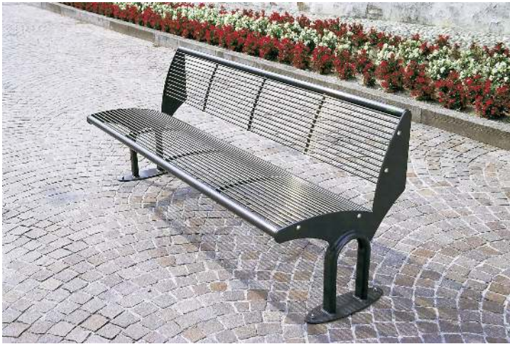
Sitzbank TAURUS mit Rückenlehne, in RAL 7016 anthrazitgrau