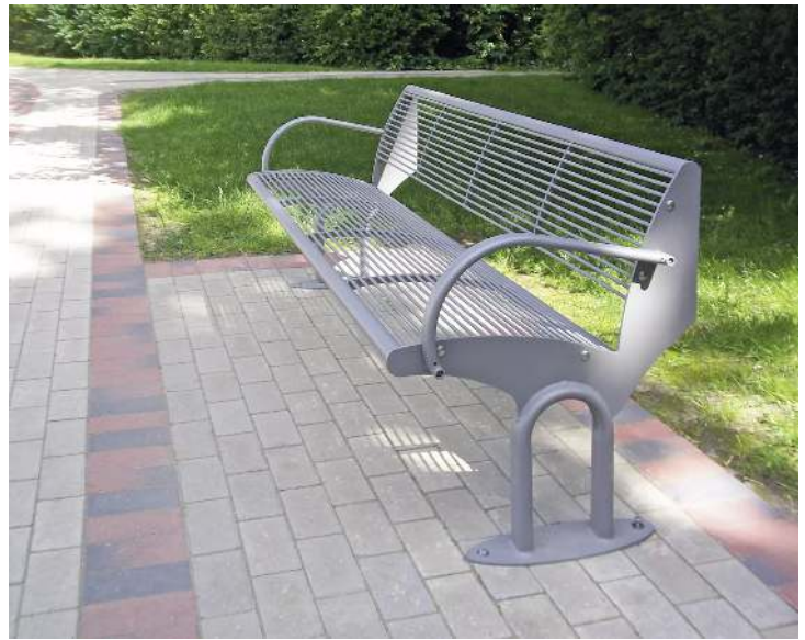
Sitzbank TAURUS mit Rückenlehne und Armlehnen, in RAL 9007 graualuminium