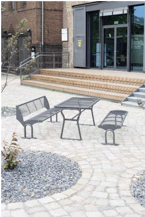
Sitzbank TAURUS ohne Rückenlehne, in RAL 7016 anthrazitgrau