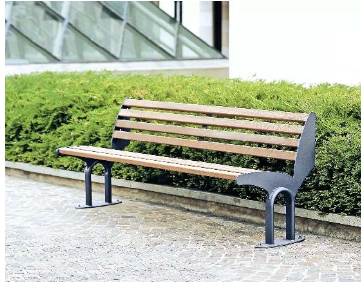
Sitzbank TAURUS mit Rückenlehne, mit Hartholzbelattung, Stahlteile in RAL 7016 anthrazitgrau