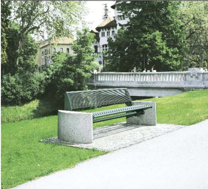
Sitzbank TAURUS mit Rückenlehne, Stahlteile in RAL 6005 moosgrün