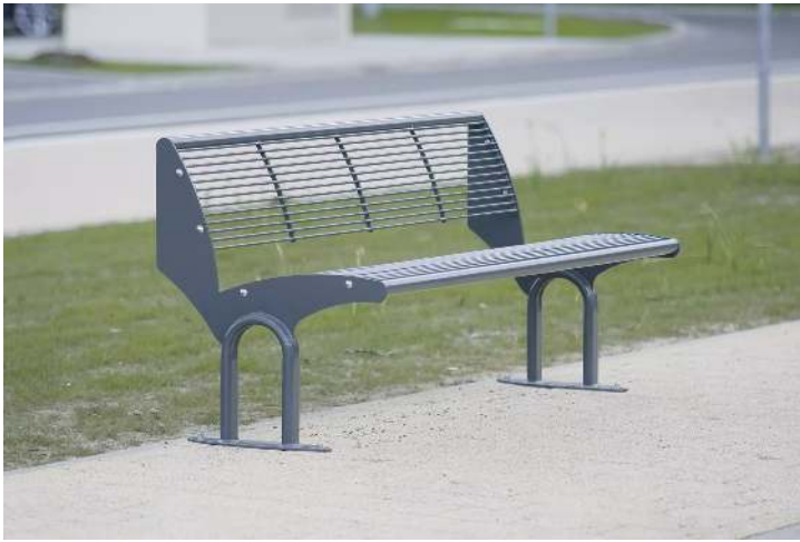
Sitzbank TAURUS mit Rückenlehne, in RAL 7016 anthrazitgrau