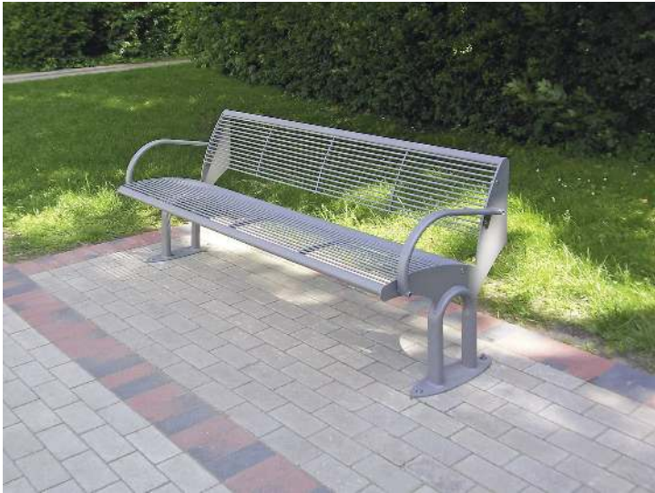
Sitzbank TAURUS mit Rückenlehne und Armlehnen, in RAL 9007 graualuminium