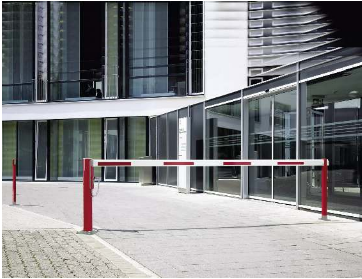
Wegesperre FLEN zum Aufdübeln, mit zwei höhenverstellbaren Auflagestützen, Sperrbreite 4,0 m