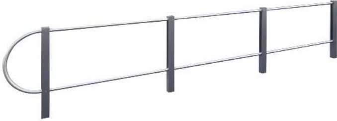
Geländersystem BARR zum Einbetonieren, mit Flachkopf