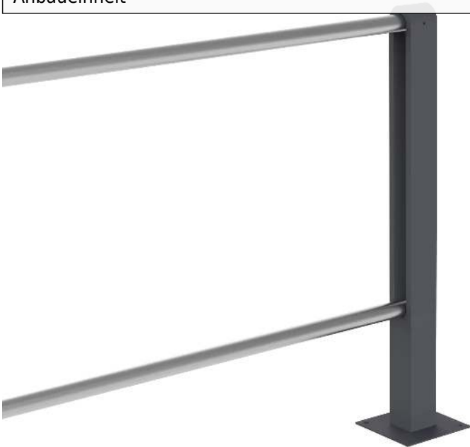
Geländersystem BARR zum Aufdübeln, mit Rundkopf, Anbaueinheit