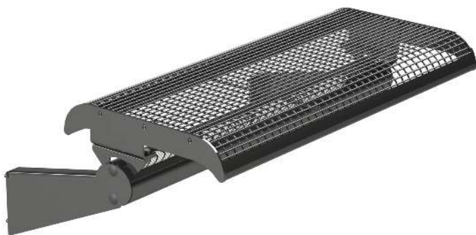
Sitzbank LINUS, 2-Sitzer ohne Rückenlehne, zur Wandbefestigung, in DB 703 eisenglimmer