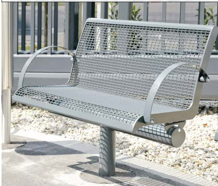
Sitzbank LINUS mit Mittelfuß zum Einbetonieren (auftragsbezogene Anpassung auf Anfrage)</div>