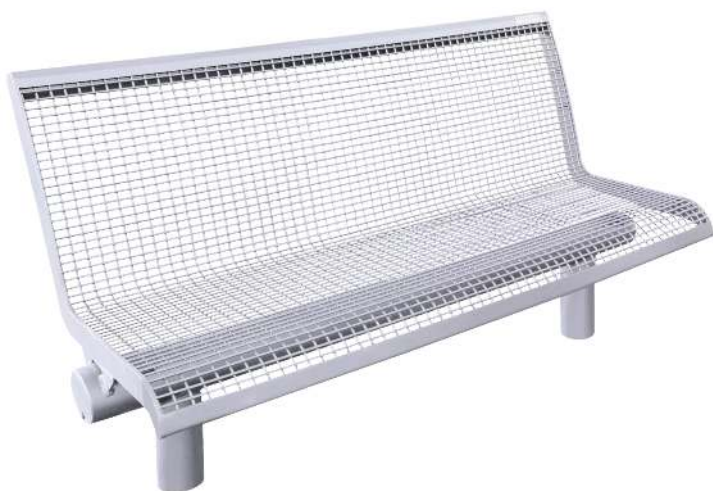
Sitzbank LINUS mit Mittelfuß, 2-Sitzer mit Rückenlehne, zum Aufdübeln in RAL 7004 signalgrau