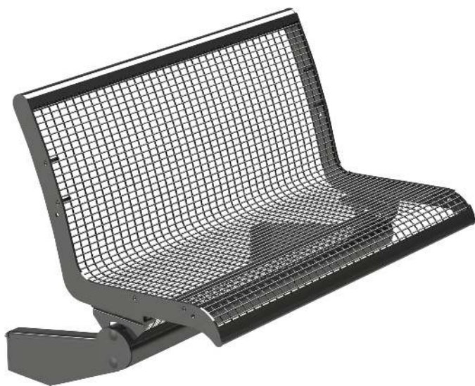
Sitzbank LINUS, 2-Sitzer mit Rückenlehne, zur Stützenbefestigung, in DB 703 eisenglimmer