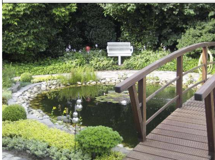
Sitzbank LINUS mit Mittelfuß zum Einbetonieren (Sonderanfertigung auf Anfrage), in RAL 9006 weißaluminium