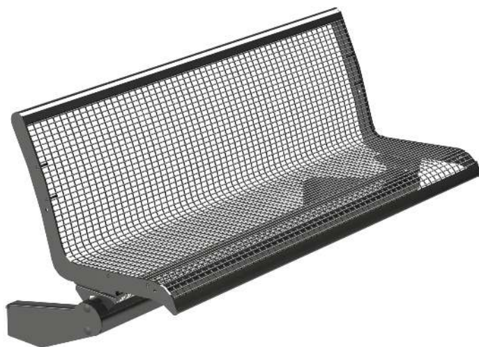
Sitzbank LINUS, 3-Sitzer mit Rückenlehne, zur Stützenbefestigung, in DB 703 eisenglimmer