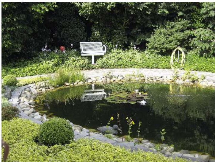
Sitzbank LINUS, 2-Sitzer, mit Mittelfuß (auf Anfrage)