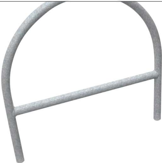
Anlehnbügel PALERMO mit Quersteg, zum Einbetonieren, feuerverzinkt