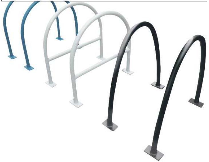
Anlehnbügel PALERMO mit und ohne Quersteg, zum Einbetonieren, in RAL 5009 azurblau, RAL 7035 lichtgrau und RAL 9005 tiefschwarz