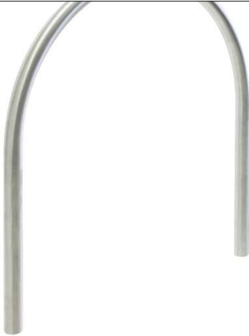
Anlehnbügel PALERMO ohne Quersteg, zum Einbetonieren, Edelstahl