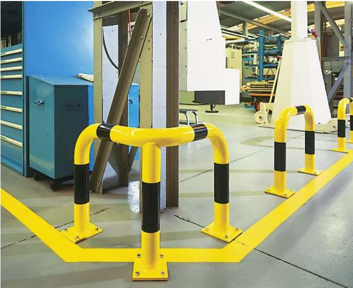
Rammschutzwinkel KEURU, gelb kunststoffbeschichtet mit schwarzen Signalstreifen