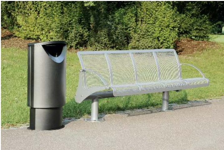
Sitzbank ASTI, 4-Sitzer, mit Armlehnen, zum Aufdübeln, in RAL 9007 graualuminium