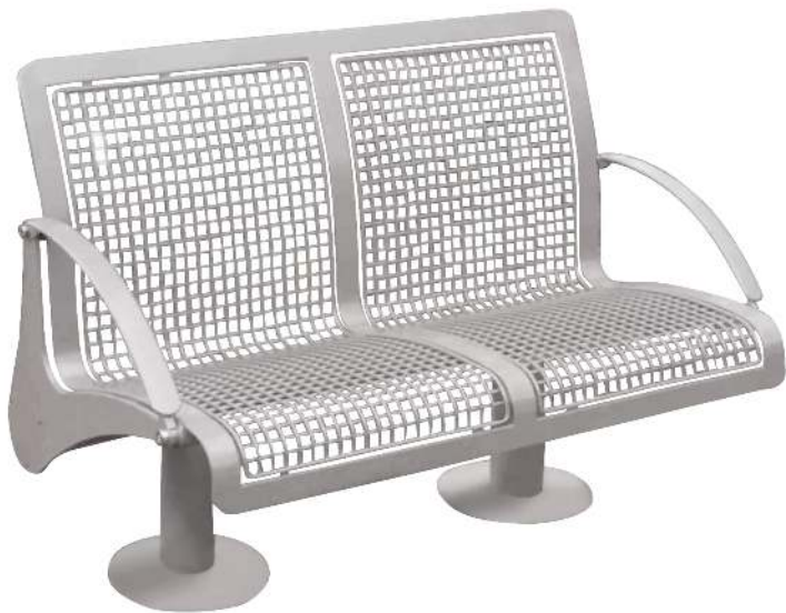
Sitzbank ASTI mit Armlehnen, 2-Sitzer, zum Aufdübeln, in RAL 9007 graualuminium