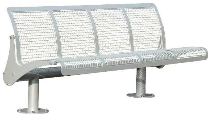
Sitzbank ASTI, 4-Sitzer, zum Aufdübeln, in RAL 9007 graualuminium