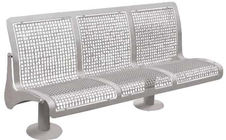
Sitzbank ASTI, 3-Sitzer, zum Einbetonieren, in RAL 9007 graualuminium