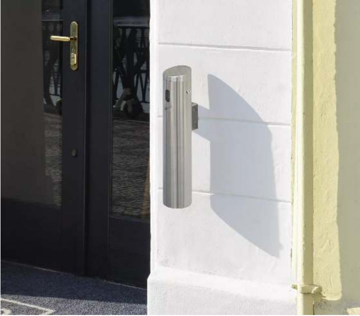
Ascher SMOKER, Wandbefestigung