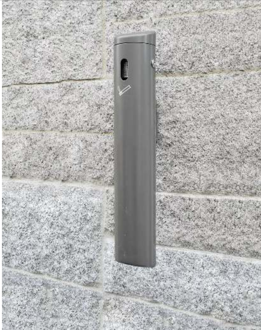
Wandascher SMOKER aus Aluminium, in DB 703 eisenglimmer