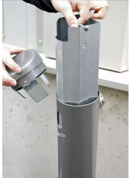
Innenbehälter zum Entleeren entnehmen