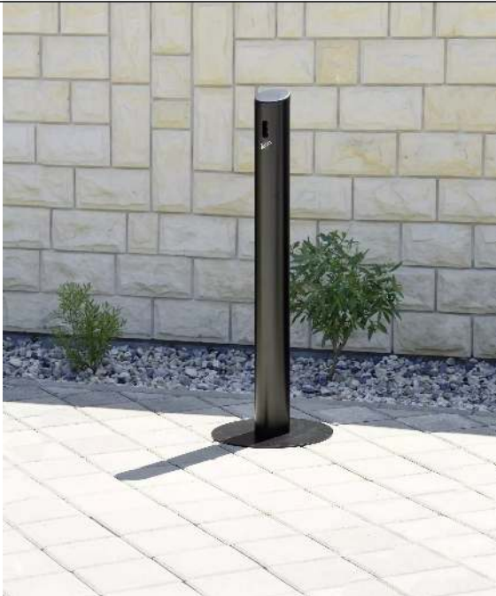
Standascher SMOKER aus Aluminium, mit Fußplatte, in RAL 9011 graphitschwarz