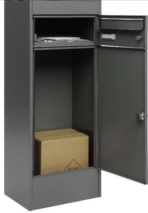
Brief- und Paketkasten CIRON in basaltgrau semimatt