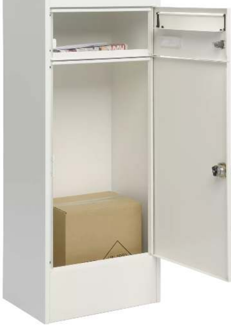
Brief- und Paketkasten CIRON in reinweiß semimatt