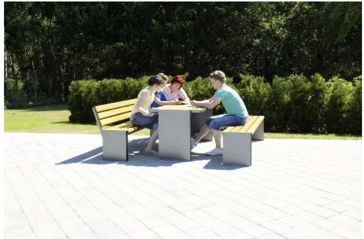
Sitzbänke NATURA ohne und mit Rückenlehne und Tisch NATURA, mit Eschenholzbelattung, Stahlteile in RAL 7016 anthrazitgrau