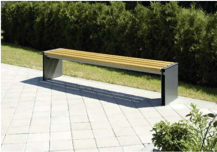
Sitzbank NATURA ohne Rückenlehne, mit Holzbelattung, Stahlteile in RAL 7016 anthrazitgrau