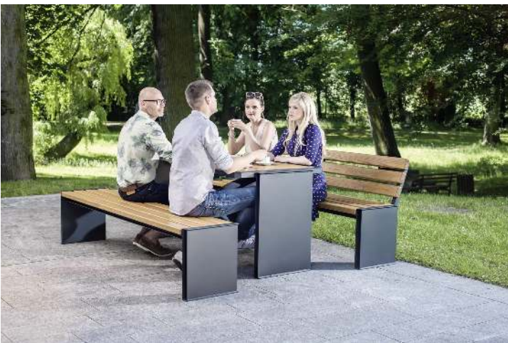
Sitzbänke NATURA ohne und mit Rückenlehne und Tisch NATURA, mit Eschenholzbelattung, Stahlteile in RAL 7016 anthrazitgrau