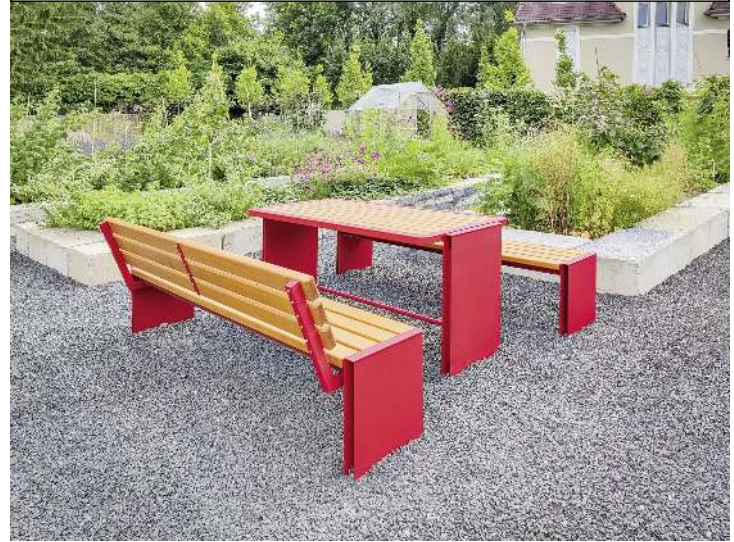
Sitzbänke NATURA ohne und mit Rückenlehne und Tisch NATURA, mit Eschenholzbelattung, Stahlteile in RAL 3002 karminrot