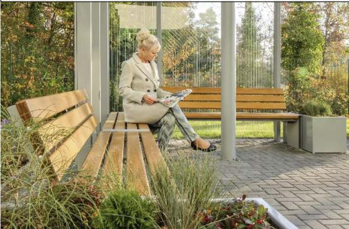
Sitzbank NATURA mit und ohne Rückenlehne, mit Eschenholzbelattung, Windschutzwand PIN SCREEN, Meeting-Point PIN, Pflanzbehälter MALOUT, Stahlkonstruktion in RAL 7046 telegrau