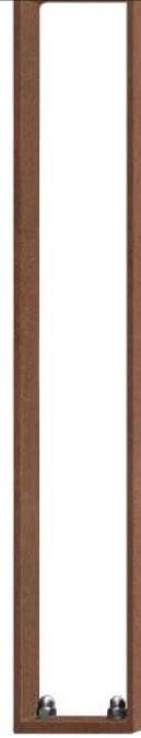
Anlehnbügel LOWELL, zum Aufdübeln, in Cortenstahl