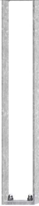
Anlehnbügel LOWELL, zum Aufdübeln, feuerverzinkt