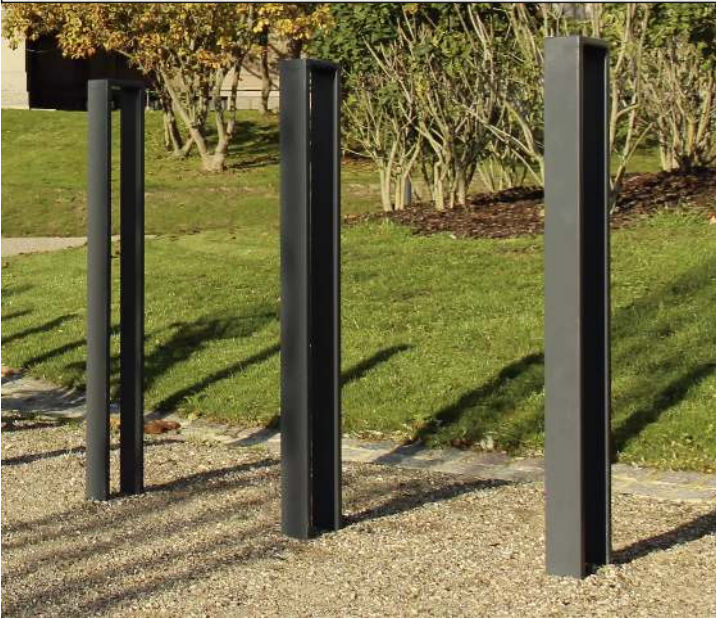
Anlehnbügel LOWELL, zum Einbetonieren, in RAL 7021 schwarzgrau