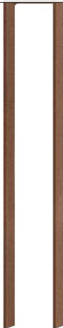
Anlehnbügel LOWELL, zum Einbetonieren, in Cortenstahl