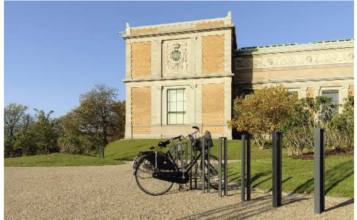
Anlehnbügel LOWELL, zum Einbetonieren, in RAL 7021 schwarzgrau