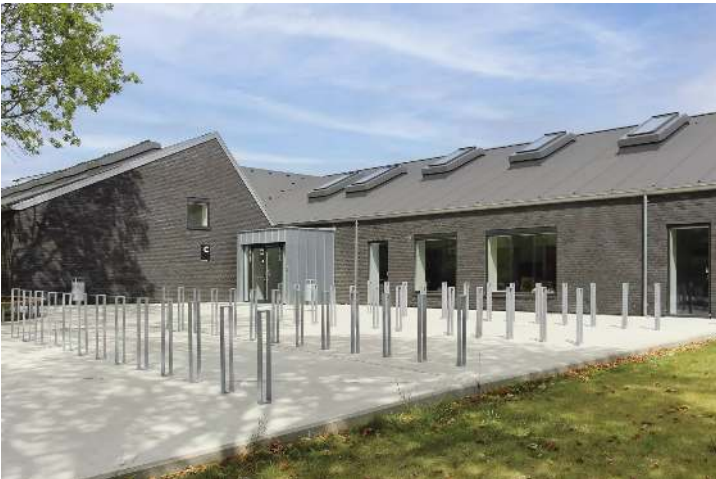
Anlehnbügel LOWELL, zum Aufdübeln, feuerverzinkt