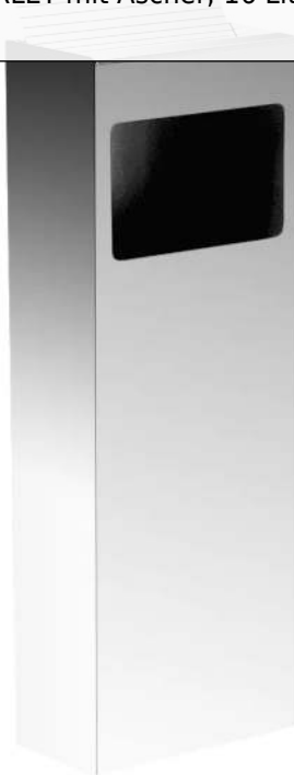
Abfallbehälter MORLEY mit Ascher, 16 Liter, in RAL 9006 weißaluminium