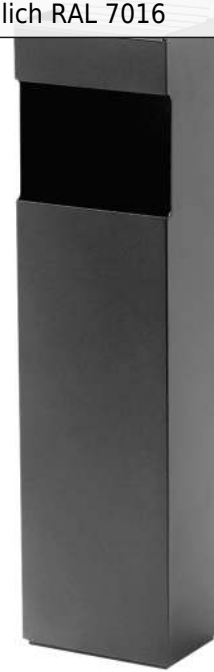
Abfallbehälter MORLEY mit Ascher, 12 Liter, in anthrazitgrau ähnlich RAL 7016