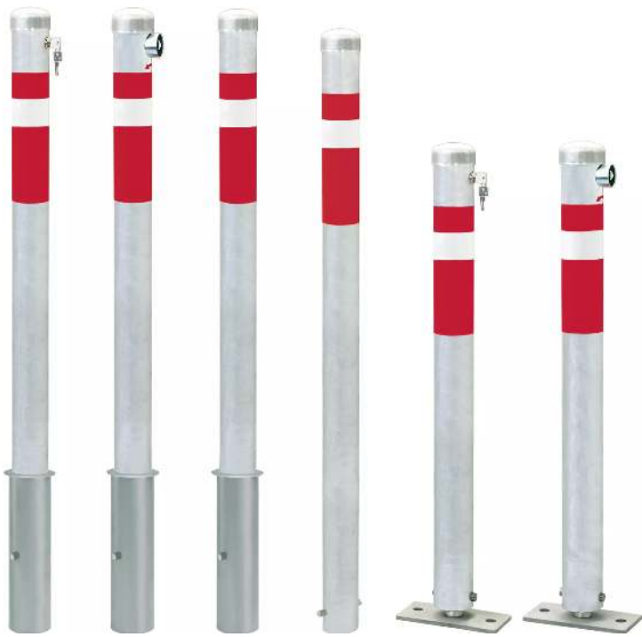
Sperrpfosten RUBI zum Aufdübeln, mit Bodenplatte, vorgerüstet für Zylinder