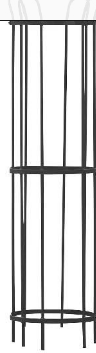
Baumschutzgitter TULIP, 1870 x 555 mm, in RAL 9005 tiefschwarz