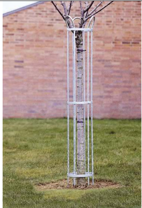
Baumschutzgitter TULIP, 1500 x 345 mm, feuerverzinkt