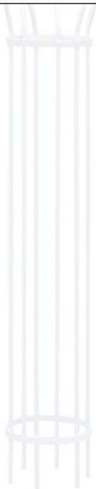
Baumschutzgitter TULIP, 1870 x 345 mm, feuerverzinkt