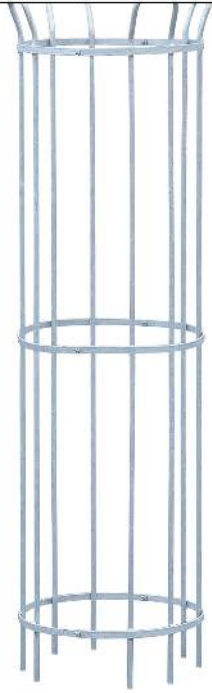
Baumschutzgitter TULIP, 1870 x 555 mm, feuerverzinkt