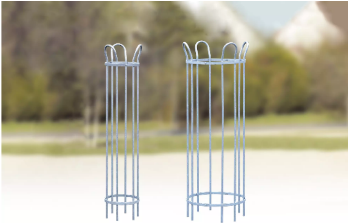
Baumschutzgitter TULIP, feuerverzinkt