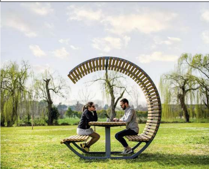
Freizeitüberdachung CISON CONTEA mit Tisch und Sitzbänken, kreisförmig, mit Kiefernholzbelattung, Stahlteile in RAL 2002 blutorange