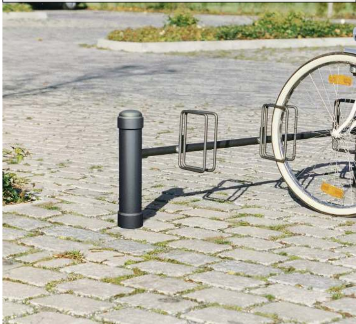
Fahrradständer mit Poller STIL 76 einseitig, 3 Stellplätze, in RAL 7016 anthrazitgrau