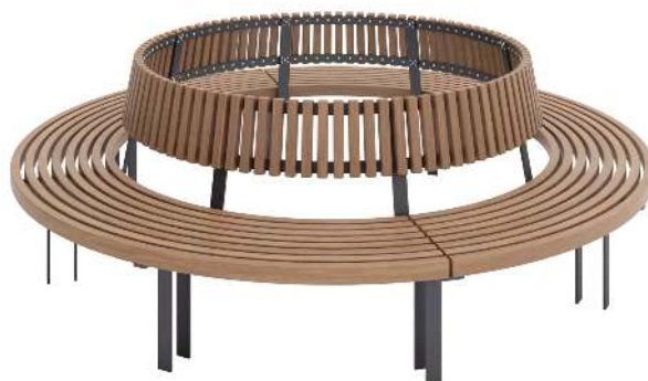
Rundbank IKAST mit Rückenlehne, Ø 2500 mm, Stahlteile in RAL 7016 anthrazitgrau