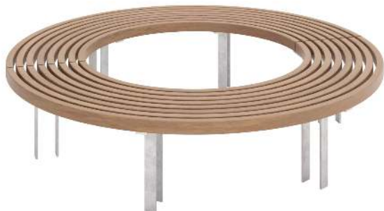
Rundbank IKAST ohne Rückenlehne, Ø 1900 mm, Stahlteile feuerverzinkt