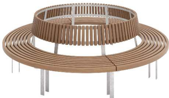
Rundbank IKAST mit Rückenlehne, Ø 2500 mm, Stahlteile feuerverzinkt