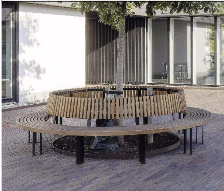
Rundbank IKAST mit Rückenlehne, Ø 3000 mm, Stahlteile in RAL 7016 anthrazitgrau