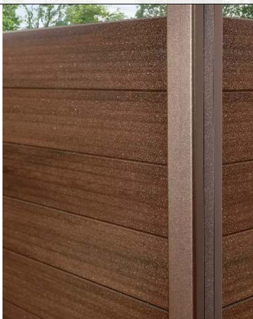
Detail: Grundstütze DB, verstärkter Schallschutz für Sicht- und Schallschutzwand LYNWOOD in RAL 8011 nussbraun