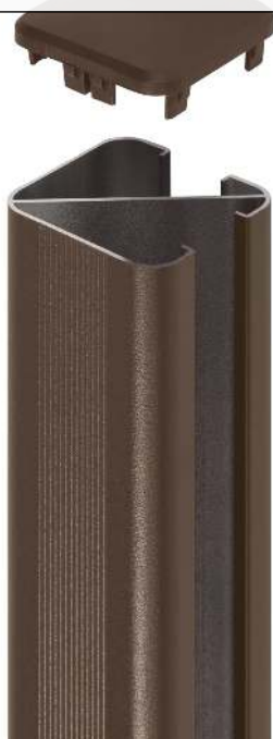
Detail: Eckstütze für Sicht- und Schallschutzwand LYNWOOD in RAL 8011 nussbraun