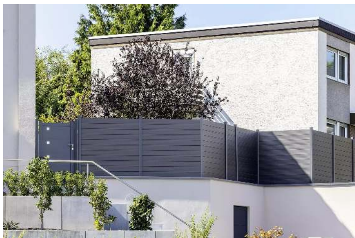
Schallschutzwand LYNWOOD, Stützen in RAL 7021 schwarzgrau und Wandelemente in anthrazit