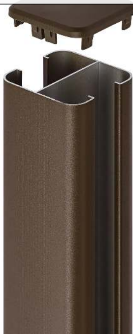
Detail: Grundstütze, Standardausführung für Sicht- und Schallschutzwand LYNWOOD in RAL 8011 nussbraun