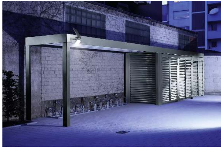
Solarleuchte XSOLAR in anthrazit