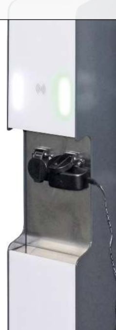
Ladesäule CAVAN, mit RFID-Zugangsautorisierung und LED-Signalisierung, Edelstahl in eisenglimmer ähnlich DB 703