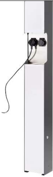
Ladesäule CAVAN, ohne Zugangsautorisierung, Edelstahl in eisenglimmer ähnlich DB 703