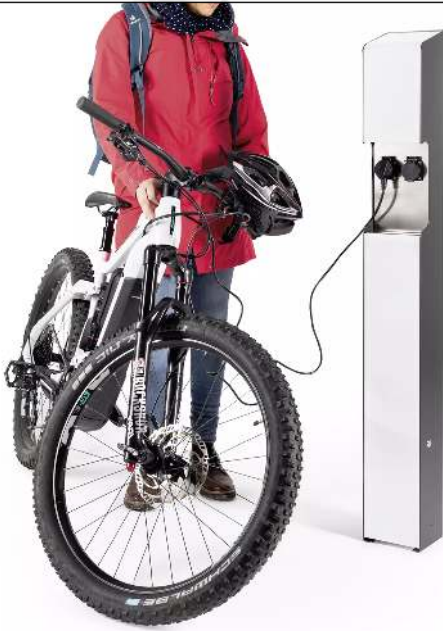
Ladesäule CAVAN, ohne Zugangsautorisierung, Edelstahl in eisenglimmer ähnlich DB 703