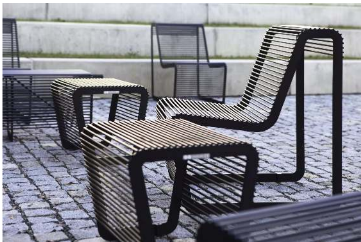
Sitz LIMPIDO mit und ohne Rückenlehne, in RAL 9005 tiefschwarz