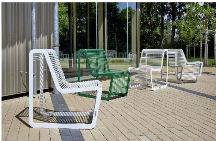
Sitz LIMPIDO mit Rückenlehne, in RAL 9003 signalweiß und RAL 6024 verkehrsgrün