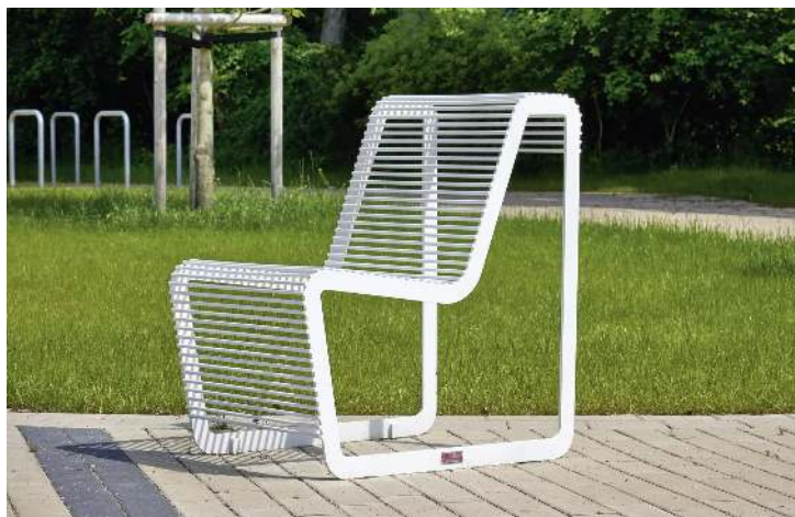
Sitz LIMPIDO mit Rückenlehne, in RAL 9003 signalweiß</div>