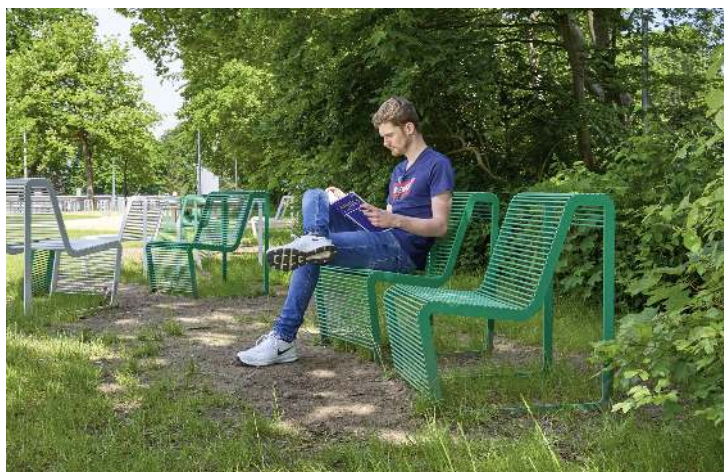
Sitz LIMPIDO mit Rückenlehne, in RAL 9003 signalweiß und RAL 6024 verkehrsgrün</div>