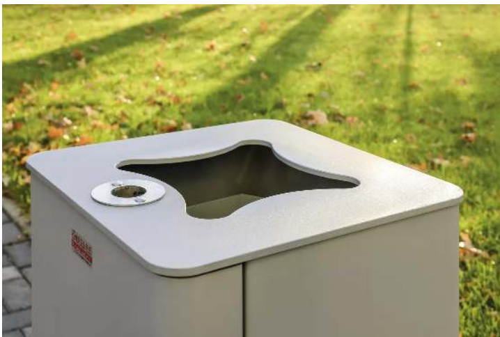
Abfallbehälter LACES mit Ascher, in RAL 7046 telegrau