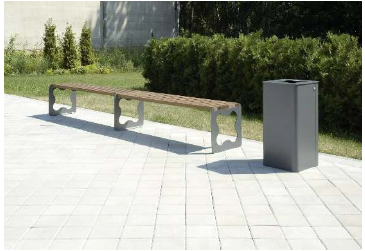
Abfallbehälter LACES mit Ascher, in RAL 7016 anthrazitgrau