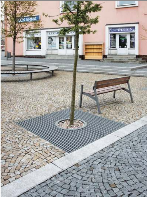
Baumschutzrost ARBOTTURA, quadratisch, ohne Baumschutzgitter