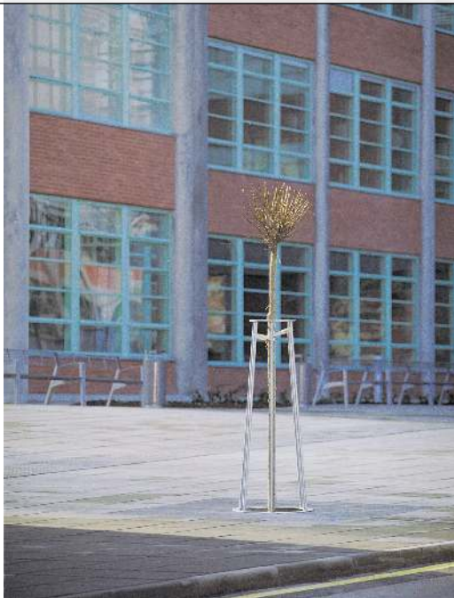
Baumschutzrost ARBOTTURA, rund, mit Baumschutzgitter