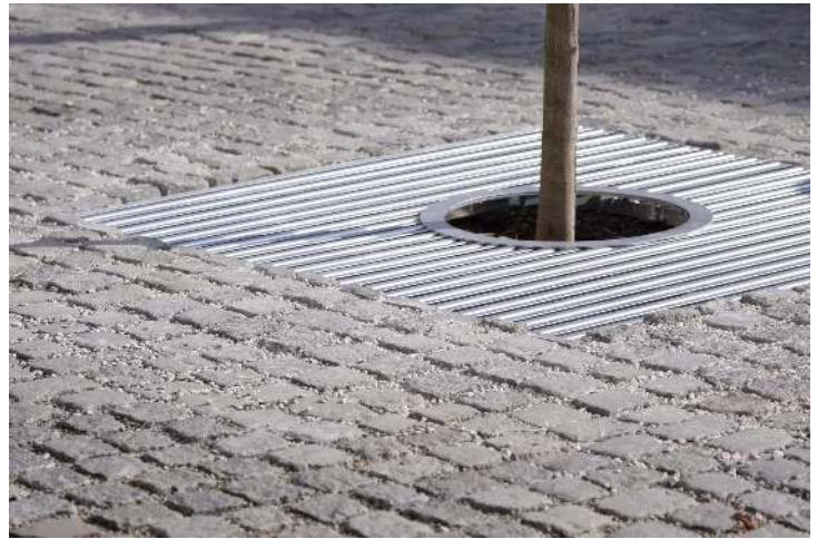
Baumschutzrost ARBOTTURA, quadratisch, ohne Baumschutzgitter