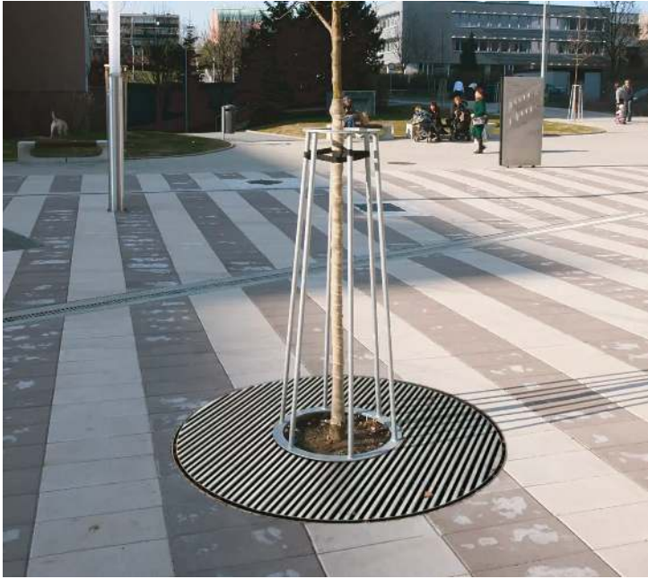
Baumschutzrost ARBOTTURA, quadratisch, mit Baumschutzgitter