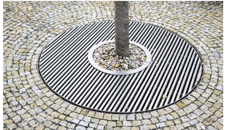
Baumschutzrost ARBOTTURA, rund, ohne Baumschutzgitter