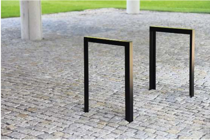
Anlehnbügel LOTLIMIT in RAL 9005 tiefschwarz