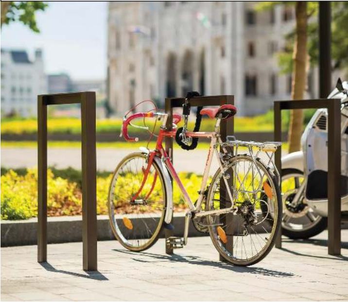
Anlehnbügel LOTLIMIT in AKZO NOBEL Interon SW325i